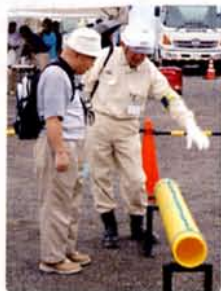
震災にも強い ポリエチレン管の説明中

東京都と昭島市など4市1町の合同防災訓練が9月1日(土)の「防災の日」に実施されました。この訓練は多摩地区を震源とする首都直下地震(マグニチュード7.3)を想定し「連携」をテーマに行われ、昭島ガスはメイン会場となったモリタウン臨時駐車場(市民会館北側)において、ガス漏れ緊急修理訓練(写真)に参加しました。