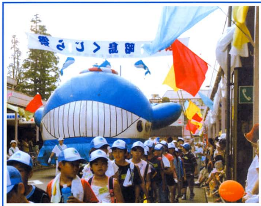
昭島市民くじら祭り