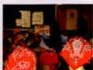
まずはエコについて

☆本日は3年生のみんなと生活に欠かせない食を通して、環境についての勉強をしました。そして実習(ちょっとだけお母さんたちにも手伝ってもらっちゃったかな)イタリアン卵スープとマッシュマロック(お菓子)を作りました。勿論環境に配慮し、味もこだわりました。「お代わり」の声がたくさん聞こえました。普段の生活の中で少しでも環境問題に関心を持っていればと思います。ご家庭でも是非、環境について話し合っただけでもいいと思います。昭島ガスでも、チームマイナス6%に参加し環境問題に取り組んでいます。