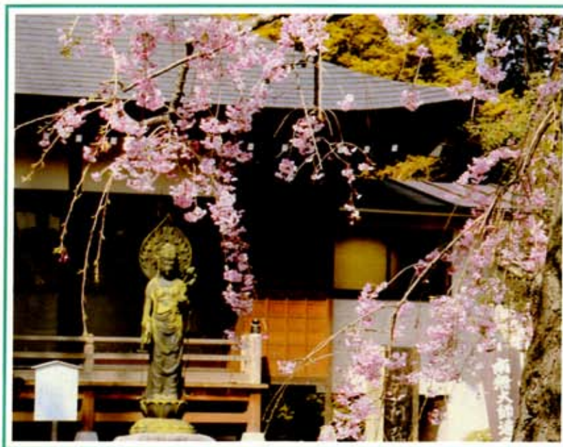
しだれ桜「阿弥陀寺境内」