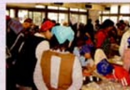
さあエコクッキング