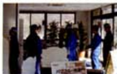
気合が入っています▶

☆昭島消防署員の前で、当社自衛消防隊員が防災訓練を行いました。審査を受けている為、やや緊張気味でしたが無事に任務を遂行しました。