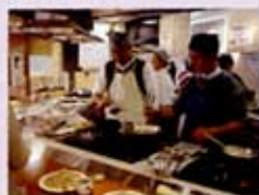
てんぷらに挑戦中