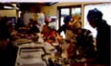
親子で共同作業中