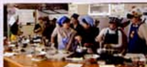
ガスでチョコ焼く中

☆昨年に続きまして今年も「大人のコース」「親子のコース」と開催しました。バレンタインという事で参加された方も力が入っているようでした。大人のコースでは「エスプレッソガナッシュ」に思いを込めてデコレーションされていました。写真はスペースの関係で1枚しか掲載出来ませんが皆さん本当に力作揃いでした。親子のコースでは親子で楽しく「チョコチョコクッキー」を作りました。私も頂いて食べましたが愛情がしっかり詰まっています。美味しかったです。