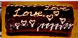
完成作品・力作です