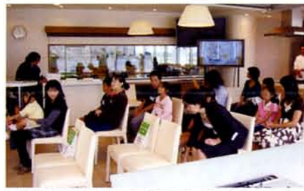
▲結果発表前 みなさんドキドキしています

10月13日(土)江東区豊洲にある「がすてなーにガスの科学館」で第1回ウィズガス全国親子クッキングコンテスト東京大会が開催されました。書類選考で選出された10組の親子の中に、昭島在住の方が2組いらっしゃいました。