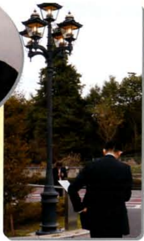
ガス灯調査? 今後のお楽しみみです