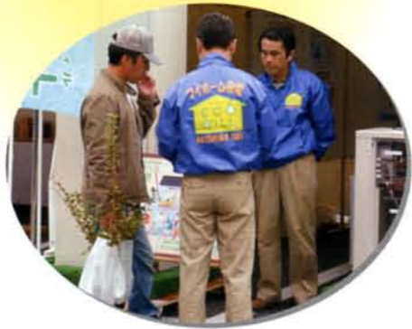
マイホーム発電に興味津々