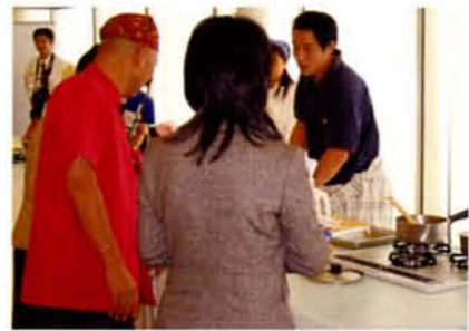
▲お父さんの腕前に審査員もビックリ

1組は、お父さんと娘さんによる「アッパリ!サンマ」サンマの春巻きです。サンマの下ろし方もプロなみ、味も大変おいしかったです。