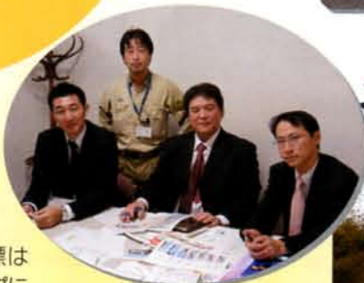
今回のリニューアルスタッフです

現在昭島ガスホームページのリニューアル作業を行っています。目標は12月末のアップに向けて奮闘中!! 会議室だけでなく、なぜかガス灯のまわりでも、打ち合わせしています。(あまり大きな声ではいえませんが、作業が若干遅れていまして…。)楽しいホームページになるよう作業を進めていますのでご期待下さい。