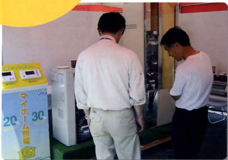
エコウィルのご案内中

メニューは、揚げ物機能を使用し180℃で揚げたミニアメリカンドックと、グリルタイマーを使用したラスクを作りました。みなさま「ラスクをグリルで作れるの?」といったおどろきの声が多く聞かれました。ご自宅でおやつにもピッタリですね。オアジの方はもちろんおいしかったですよ。