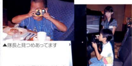
▲隊長と見つめあってます▶