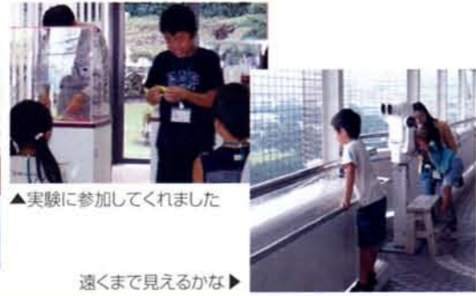
▲実験に参加してくれました