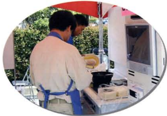
ただいま調理奮闘中